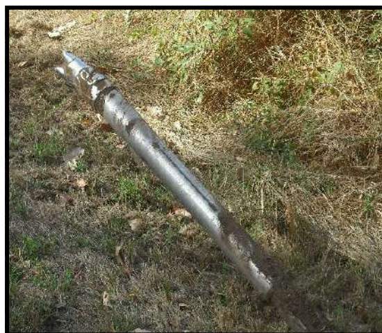
La tête de forage permettant le passage des nouvelles gaines.