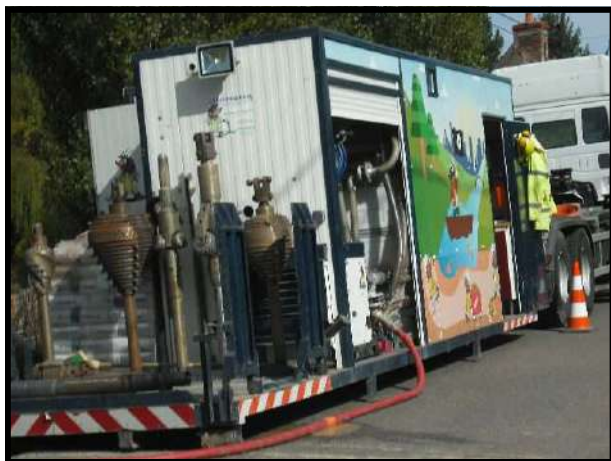
L'unité mobile destinée au forage.

La part communale pour l'enfouissement du réseau de télécommunication est de 14976€ TTC.