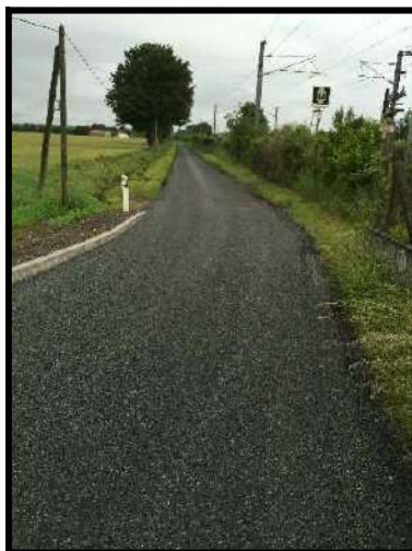
Le chemin de Chevannes