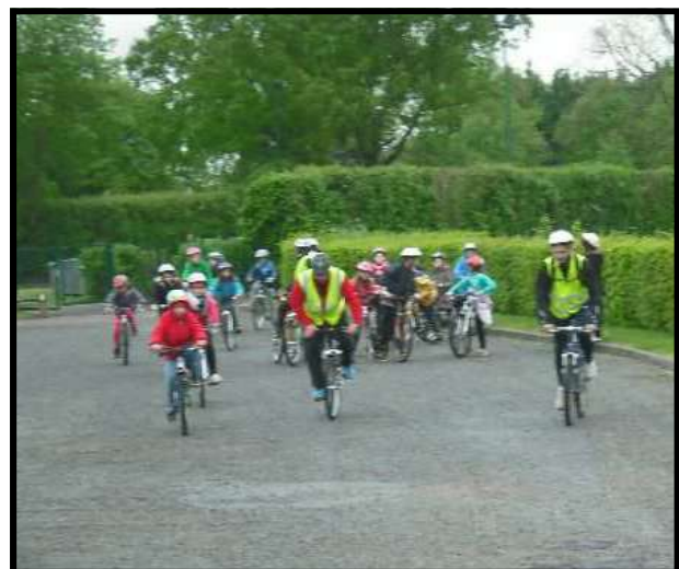
C'est déjà l'heure du départ vers le circuit de Magny-Cours.