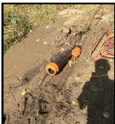
Les gaines sont prêtes à recevoir les câbles.