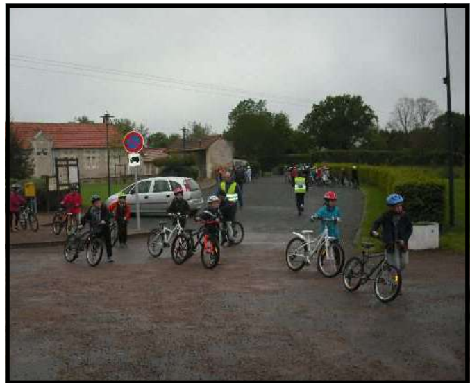
Sous un ciel bien gris, la pause ravitaillement a été fort appréciée.