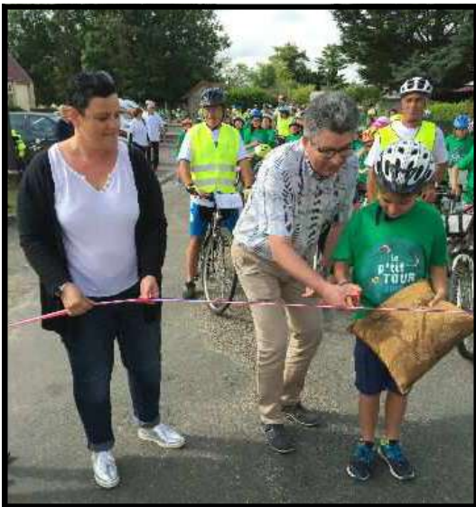
Le départ est sur le point d'être donné.

Après 40 kilomètres de randonnée dans la Nièvre, les jeunes cyclistes se sont tous rejoints au circuit de Magny-Cours . Une partie de ces jeunes courageux a fait une halte bien méritée à Mars sur Allier.