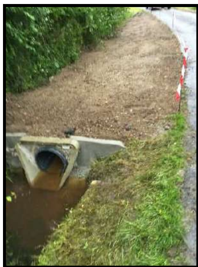
Le chemin de Buy