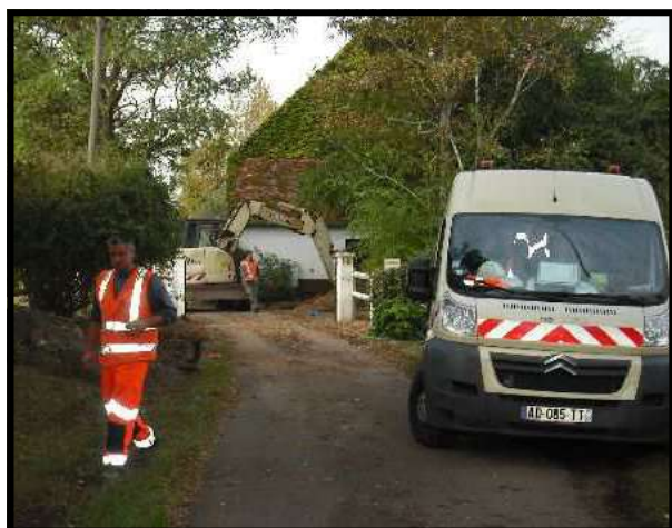
Les travaux près du haras.

Les travaux d'éclairage public pour cette portion de voie pourraient être réalisés en 2017 ou 2018 pour un coût global de 30 500€ HT dont 13 200€ à la charge de la Commune.