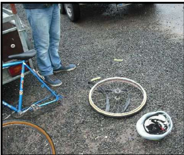
C'est aussi l'occasion de faire quelques réparations.