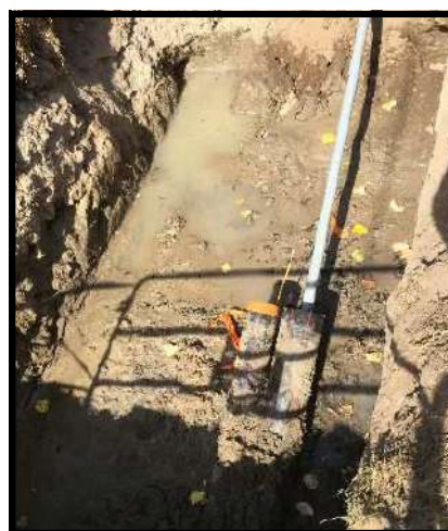
Les câbles une fois glissés dans leur gaine.