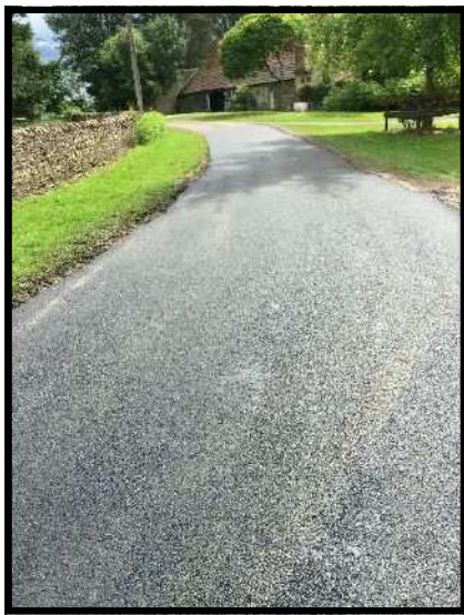
Le chemin de Bruzeau

La commune a également entrepris la réfection de certaines voies de circulation.